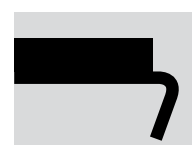
EZ BB Segmenthöjd: 12 mm