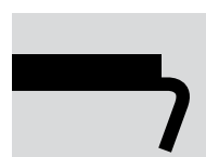
EZ SB Segmenthöjd: 8 mm

Skillnaden mellan SB (Small Block) och BB (Big Block) är höjden på segmentet. För att kunna se skillnad på verktygen efter en tids användning så är kanterna rundade på SB segmenten