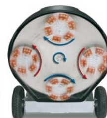
A- och B versioner krävs för HDX modeller.