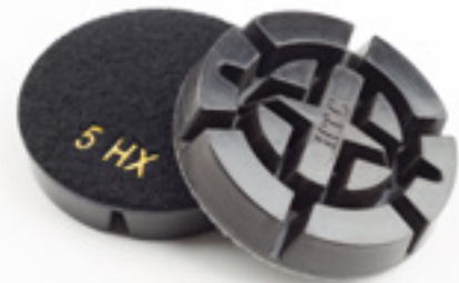
DT 5 HX - Item no: 593330502