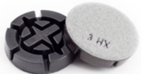
DT 3 HX - Item no: 593330403

Das Endergebnis eines Schleifprozesses zeigt sich nicht selten erst, nachdem der letzte Polierschritt abgeschlossen wurde. Um sicherzustellen, dass unsere Werkzeuge Oberflächen von höchstmöglicher Qualität erzeugen, messen wir bei HTC während der Entwicklungsphase die Oberflächenrauheit. So können Sie sicher sein, dass Sie ein Werkzeug erhalten, welches unter anspruchsvollsten Bedingungen getestet wurde.