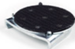
EZ Wing Metal 3" Puck Holder - Item no: 596944501