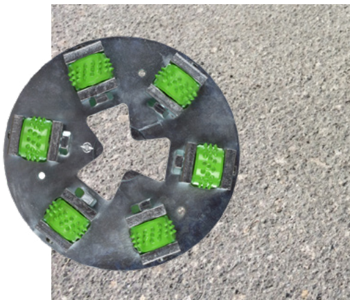
Betonprofil nach einem Bearbeitungsdurchgang mit dem HTC Ravager™

Mit diesem HTC Ravager™ - Werkzeug kann ein standardmäßiges Oberflächenvorbereitungsprofil, das dem Betonoberflächenprofil-Standard von 6-7 des International Concrete Repair Institute (I.C.R.I.) [Internationales Institut für Betonreparatur] entspricht, erreicht werden.