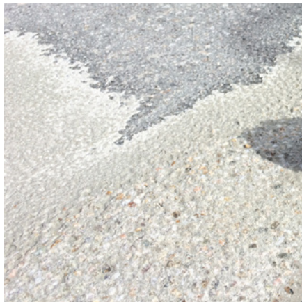
Die Reste eines 10 mm dicken Überzugs nach drei Bearbeitungsdurchgängen mit dem HTC Ravager™