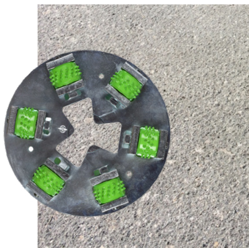
Betongyta efter en överfart med HTC Ravager™