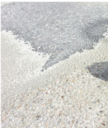
Resterna efter en 10mm beläggning efter tre överfarter med HTC Ravager™