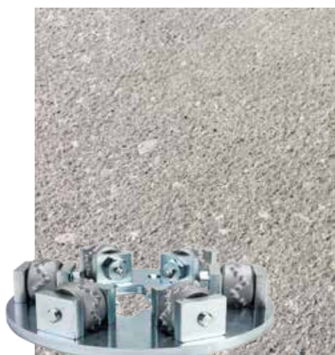
Betongyta efter en överfart med HTC Ravager™

Med HTC Ravager verktygen monterade på en HTC slipmaskin kan man uppnå ytstandarden för golvpreparering enligt Concrete Repair Institute (I.C.R.I) "Concrete surface profile" (C.S.P) 6-7.