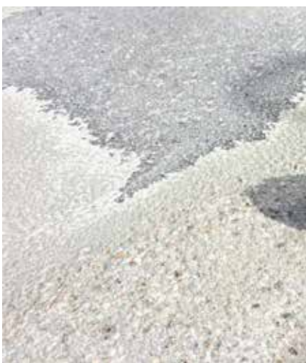
Resterna efter en 10mm beläggning efter tre överfarter med HTC Ravager™